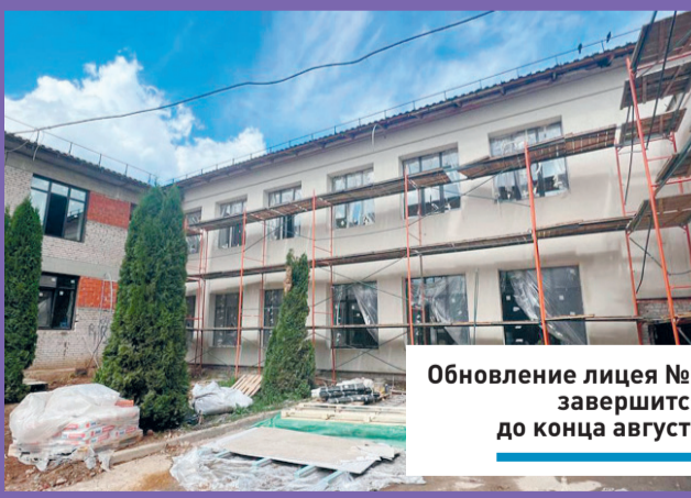
Обновление лицея №7 завершится до конца августа

Лицей №7 был открыт больше 80 лет назад, в 1937 году. С тех пор капитального ремонта в здании не было. Обновленное образовательное учреждение откроют в новом учебном году. В лицее обучаются 1267 учащихся.