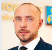
Константин МИХАЛЬКОВ, глава городского округа Солнечногорск: